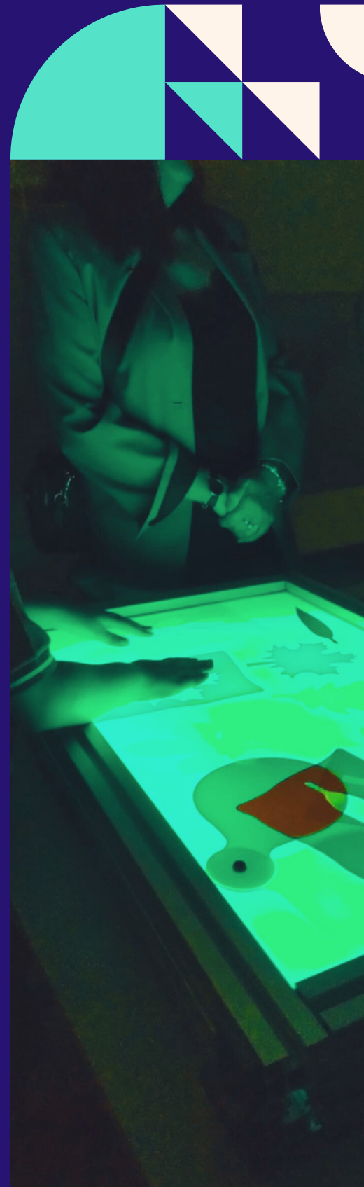
Foto: Proyecto Aps Mesas de Luz para Escuelas Infantiles. IES Miguel Catalán